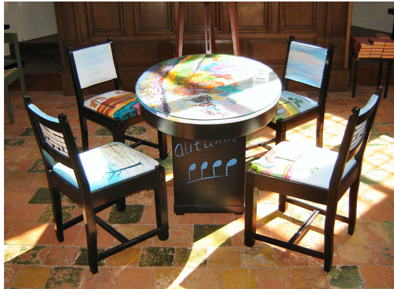
De vier jaargetijden

Maar de jaargetijden bedoelen niet alleen de twaalf maanden, ook de cyclus van een mensenlevens. En wie wat bekend is in de streek zal gemakkelijk de Drentsche Aa herkennen. Het is de tafel van ons eigen leven. Maar hier in de kerk daarmee óók de tafel van de gemeenschap. Waar plek is, voor jezelf, maar ook voor anderen. Waar de ontmoeting, maar ook de viering plaatsvindt. Welkom zijn we aan die tafel. Maar het mag verder gaan dan dat.