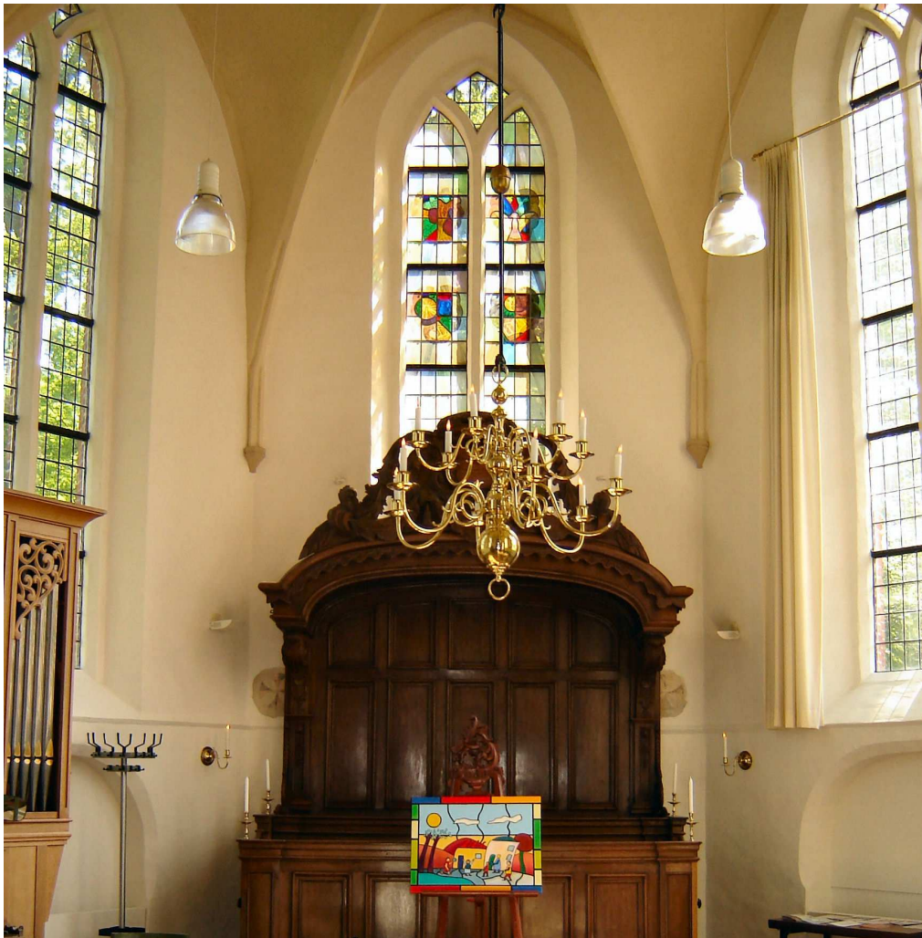
Het Feest van de Geest