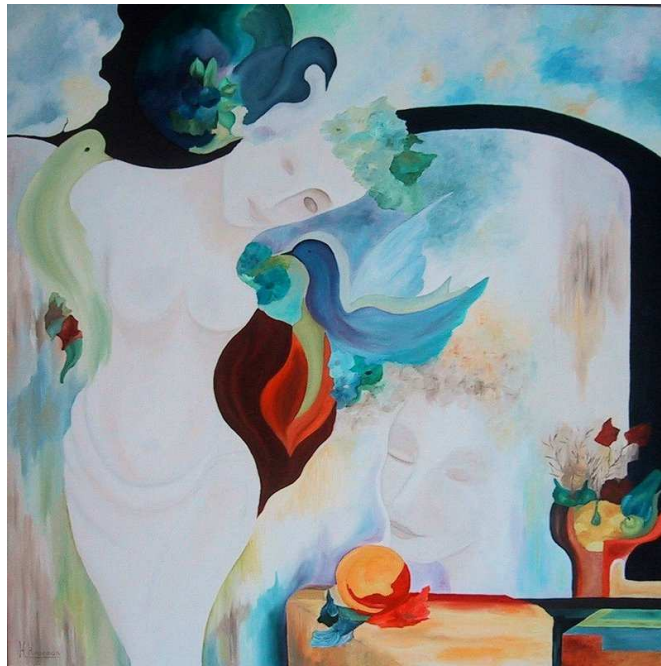
Voeding van de Geest

Zo'n vrouw zien we ook in het schilderij aan de zuid-oost kant van het koor, twee zelfs. Waar de geest eerst nog een wervelende vrouw is, is ze hier ingetogen en mijmerend. Dit is geen harde boodschap van buigen of barsten, van 'moeten en niks mogen.' Dit is rond en zacht, koesterend en liefelijk. 'De voeding van de Geest' waaruit zich vogels, duiven, losmaken om fladderend uit te vliegen en zich te gaan verspreiden.