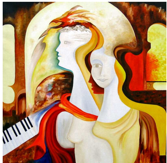
Liefde voor Hem

Zeker heeft de kerk dat geprobeerd, en niet zelden is dat ook het beeld van de kerk van buitenaf. Zo is ook de verbeelding kerkelijk vaak verdacht geacht. Zeker ook in de protestantse traditie; die we op die manier vandaag dus niet doorzetten. Zegt het tweede gebod niet: gij zult u geen gesneden beelden maken? Weg met al die frutsels! Maar daarmee volgde men de letter, maar niet de geest van de Schrift! En je kunt je serieus afvragen of niet juist zó de boodschap geweld aan werd gedaan. Want het beeldenverbod gaat erom dat je God niet in de greep kunt krijgen, niet kunt vastpinnen, niet kunt maken als jouw beeld, niet kunt vastleggen in dogmatische systemen. En juist de schilderijen hier in de kerk doen aan dat mysterie recht, en bevragen een al te stellige duidelijkheid. In plaats van 'over' spreken ze meer 'van' God.